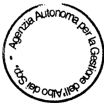
TABELLA COMPLESSIVA N. 2